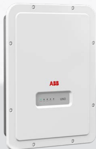
UNO-DM-TL-PLUS-Q inverter di stringa

UNO-DM-1.2/2.0/3.0-TL-PLUS-Q da 1.2 a 3.0 kW